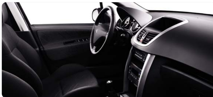
Juoda / metalo Zindal medžiaga