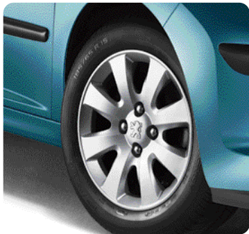
Ratlankis Perth , 16 colių