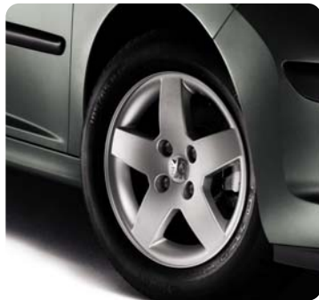
Ratlankis Alu Monaco , 15 colių*