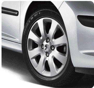
Ratlankis Hobart , 15 colių