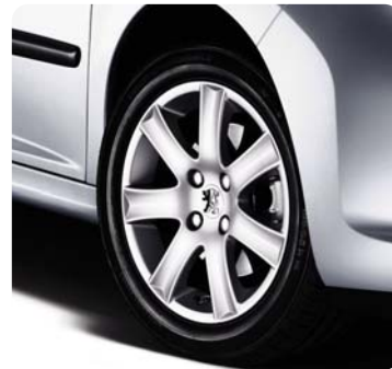
Ratlankis Alu Spa , 16 colių*