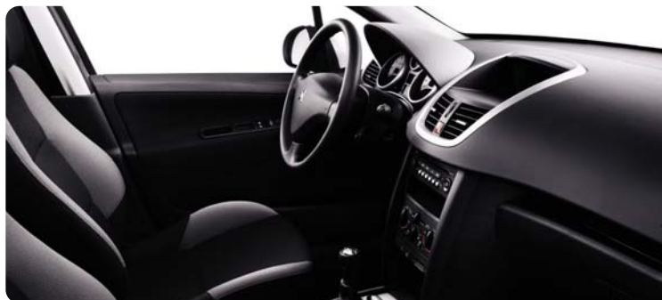
Juoda Pachinko medžiaga