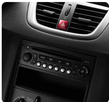
Pilka interjero detalė Lion