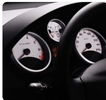
Sujungti Trendy 4 balti ciferblatai