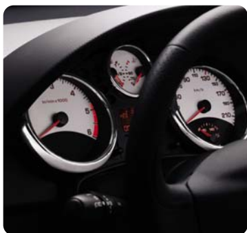
Sujungti Premium 5 balti ciferblatai